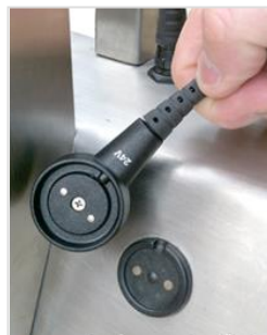
Levereras alltid med laddare för 24 Volt. Laddkontaktarna är magnetiska och kan inte placeras fel.