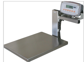
Plattform med våg, art 80090