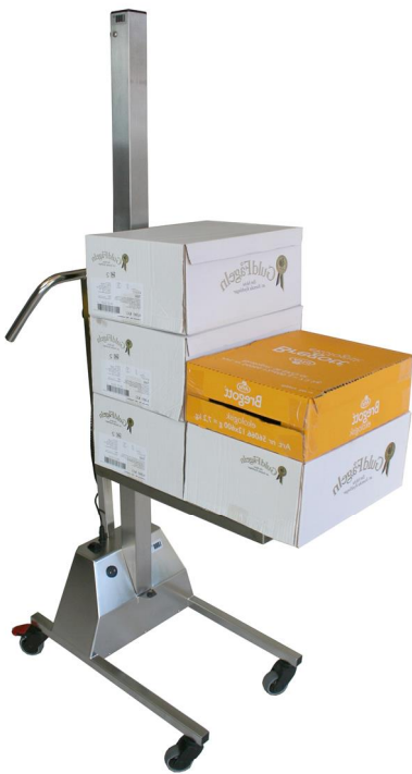
LD80 med lådor.