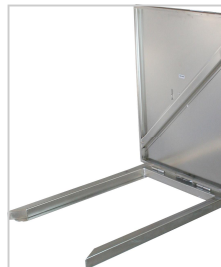
Kombiflak; GN-gafflar och flakskiva art 80060