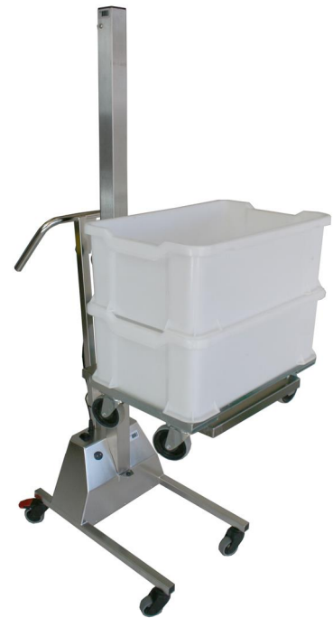
LD80 med tralla och backar.