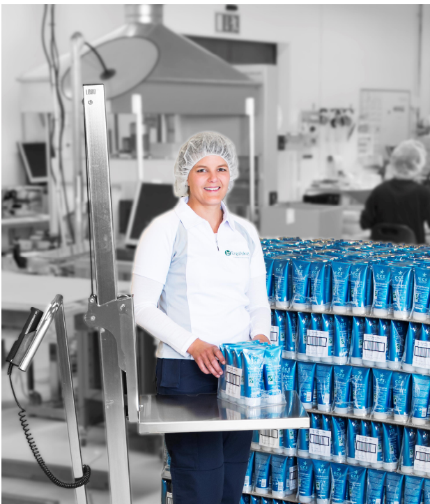
LD80 på CCS Healthcare i Borlänge.