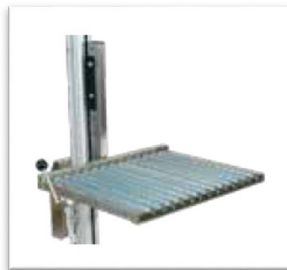
Rullflak med sidomatning