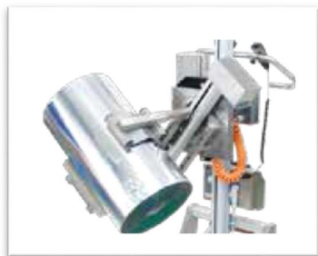
Squeeze & Turn- kläm och vrid