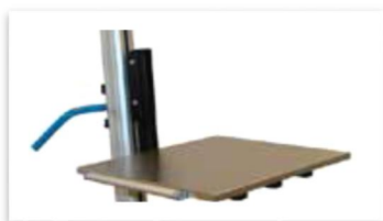
Flak med kantrulle

Vi har ett stort antal standardverktyg som lastplan, gafflar kontroll-räknevåg samt squeeze & Turn och vår pneumatiska expander Expand & turn. Vi tillverkar utöver detta även många kundspecifika verktyg.