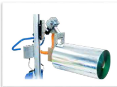
Expand & Turn- Pneumatisk expander med elektrisk vrid