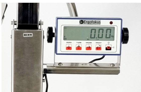
Plattformsvåg kontrollvåg. Laddas med 12 volt magnetkontakt. Spolbar. IPX5.