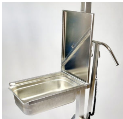
Art 80060S. LD80 med kantingaffel med fällbar standardskiva.