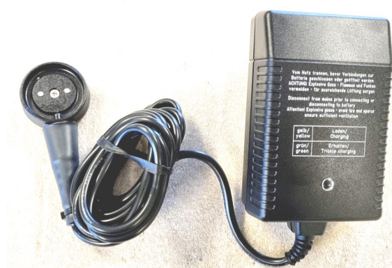
Lyftvagnen laddas med 24 volt magnetkontakt. Spolbar. IPX5.