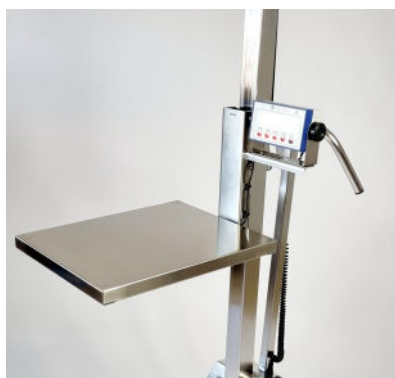
Art 80090. LD80 Plattform med integrerad kontrollvåg.

Vi kan även specialtillverka måttanpassade lyftplattformar, olika lyfthöjder och specialanpassade chassi och hjul.