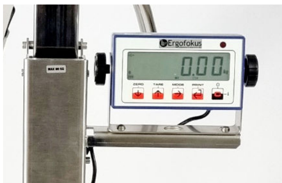
Plattformsvåg kontrollvåg. Laddas med 12 volt magnetkontakt. Spolbar. IPX5.