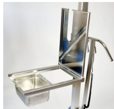
Art 80060M. LD80 kantingaffel med fällbar plattform mjölkurtag.