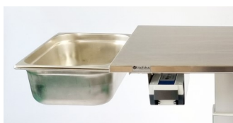
79390g kantinram för GN 1/1