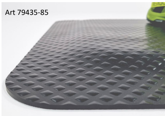
Låg mönsterprofil minimal snubbelrisk